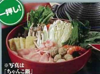
※写真は「ちゃんこ鍋」