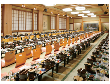
大広間150畳、中広間80畳をご用意しております。